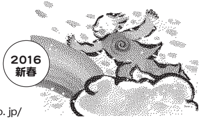
題字・絵 / とださちえ

東京都葛飾区東金町 4-3-13 FAX03-3607-0016 http://heso-no-o.jp/ f https://www.facebook.com/npo.heso.no.o